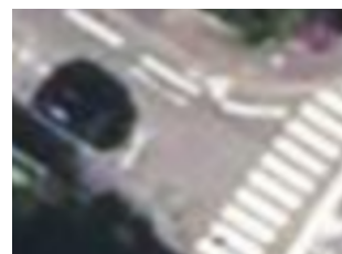
Orthophoto classique (20 cm/pixel)

L'état d'avancement du projet – réalisé à 80 % environ – est consultable en détail ici : https://www.geo2france.fr/mviewer/?config=apps/pcrs.xml#