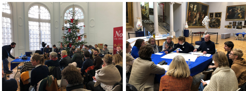
Rencontre des équipes le 24 novembre 2022 : séance plénière et ateliers de travail

Chaque année, une rencontre des équipes se formalise à tour de rôle dans chaque département, en mettant en évidence des partages d'expériences, de partenariats et de savoir-faire pouvant être mis en commun au service du territoire.