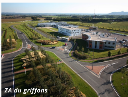
ZA du Griffons