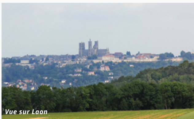
Vue sur Laon

Nous avons également commencé à préparer le dossier de consultation des entreprises pour le bilan et la révision du SCoT."