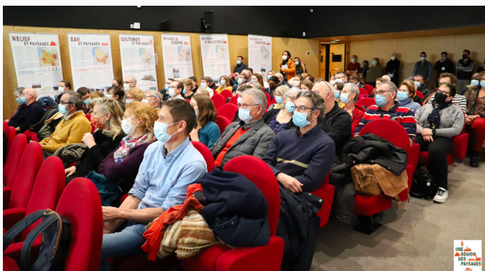
Cérémonie de remise des prix à Péronne