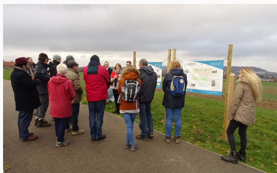
Animation dans le cadre de la démarche 40 ans 40 lieux

Dans chaque département, une exposition itinérante reprenant 8 sites a été proposée et exposée dans les EPCI et communes partenaires. Ces lieux ont fait l'objet d'un affichage spécifique sur place, qui a été le support d'animations telles que des visites sur sites, des conférences ou encore des projections programmées en complément des visites.