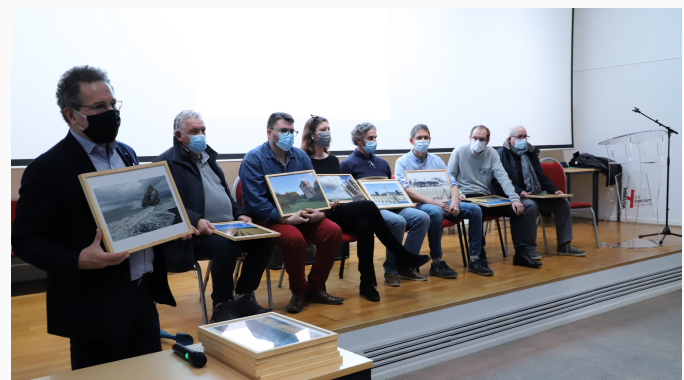
Les lauréats