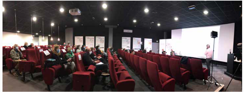
Conférence paysage, une région en transition - Beauvais