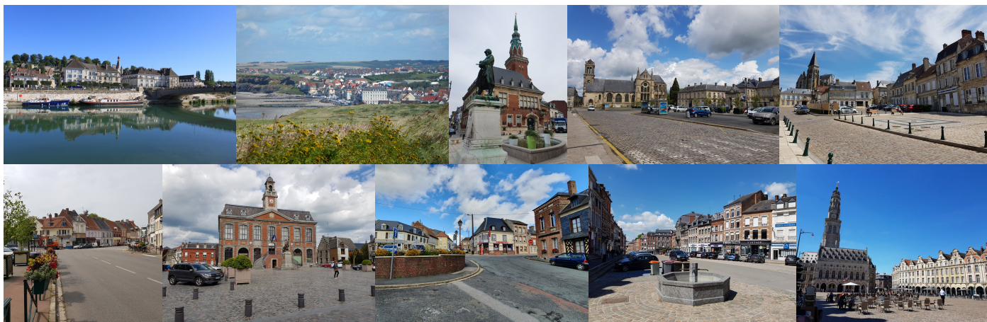
Source de gauche à droite et de haut en bas : Agence Hauts-de-France 2020-2040 : Château-Thierry, Wimereux, Bapaume, Soissons, Clermont de l'Oise, Auxe-le-Château, Landreclies, Oisemont, Avesnes-sur-Helpe, Arras

Pour en savoir plus : cf. fiche 10 - SRADDET et Gestion économe de l'espace