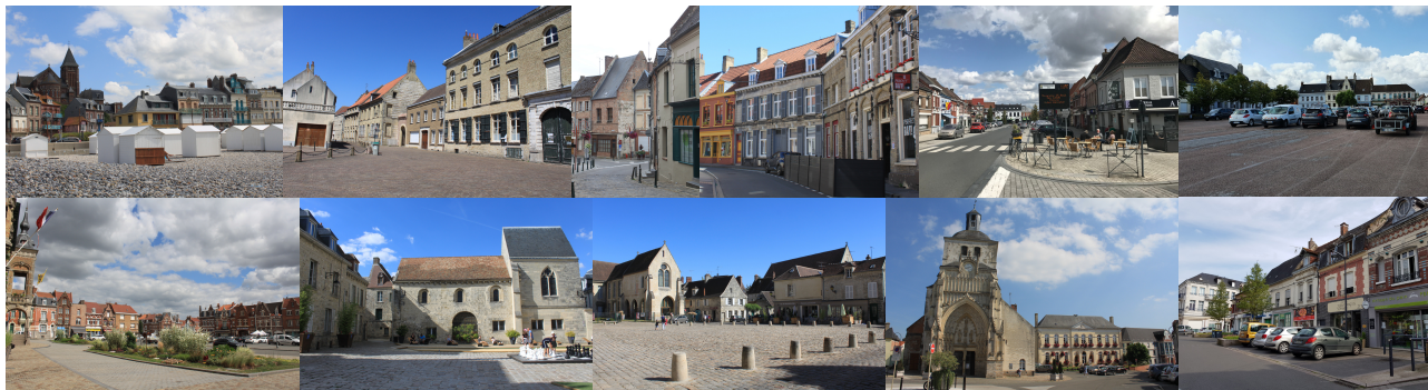
de gauche à droite et de haut en bas : Mers-les-Bains, Saint-Omer, Guise, Bergues, Steenvoorde, Audruicq, Bailleul, Laon, Senlis, Montreuil-sur-Mer, La Fère

Pour en savoir plus : cf. fiche 6 - SRADEET, transport voyageurs et intermodalité