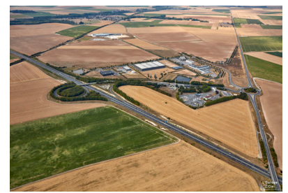
Pôle d'activité du Griffon