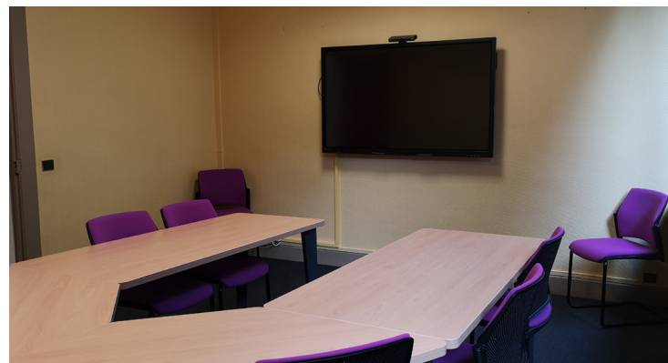
Salle de visioconférence de la CAPL mise en place en 2021

Ce nouvel environnement vers lequel la société se tourne met à l'honneur les outils numériques. De multiples rendez-vous professionnels, en ligne, par vidéo sont réalisés aujourd'hui.