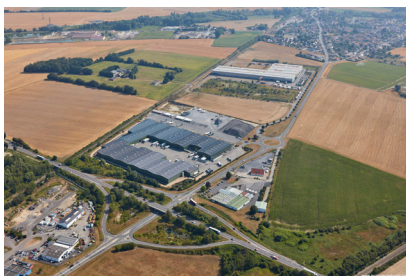
Zone d'activités les Minimes

Le territoire du Pays de Laon, c'est aussi 3 grandes zones d'activités en cours de commercialisations :