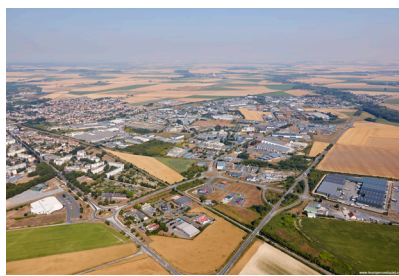
Zone d'activités Voltaire