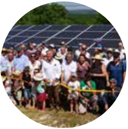
Céléwatt Lot (46) Installation solaire au sol