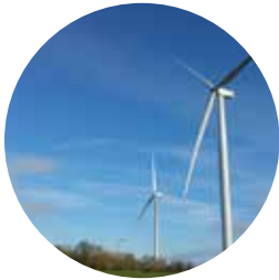
Parc de l'Hyrôme Maine-et-Loire (49) Parc éolien citoyen

Partout en France, les initiatives collectives de production d'énergie renouvelable se multiplient.