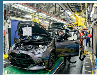
Usine Toyota, Onnaing (Nord)