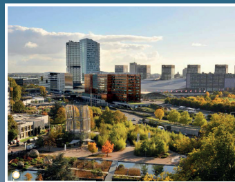
Quartier d'affaires Eurallille, Lille (Nord)