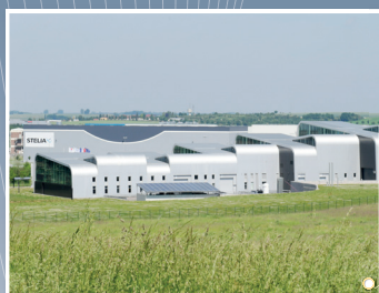
IndustrieLAB, pôle aéronautique groupe Airbus, Méaulte (Somme)