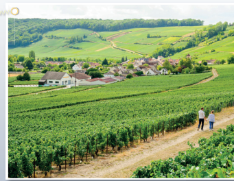
Village viticole de Bonneil (Aisne)

La région présente une grande diversité de territoires et d'espaces productifs aux dominantes variées. Ils connaissent depuis 20 ans de profondes transformations, qui s'observent également dans les paysages. Ces territoires disposent de nombreux points forts qui sont autant de richesses à valoriser dans une dynamique d'attractivité. Pour les Hauts-de-France, l'enjeu en termes de création d'activités et d'emploi est de favoriser les complémentarités entre ces territoires.