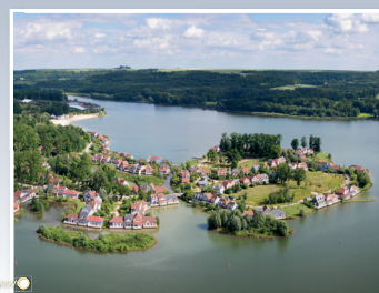
Domaine de l'Ailette (Center Parcs), Chamouille (Aisne)