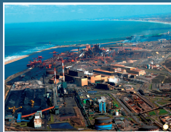
Port industriel de Dunkerque (Nord)