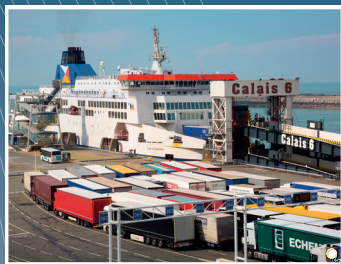
Terminal transmanche, Calais (Pas-de-Calais)