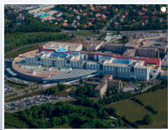
Centre hospitalier universitaire, Amiens (Somme)