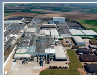
Usine de conserverie-surgélation de légumes Bonduelle, Estrées-Mons (Somme)