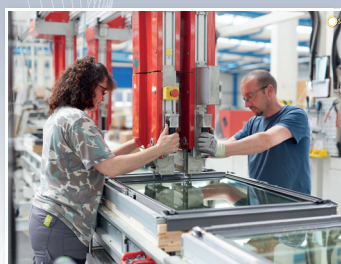
Usine VKR (Velux), Feuquières-en-Vimeu (Somme)