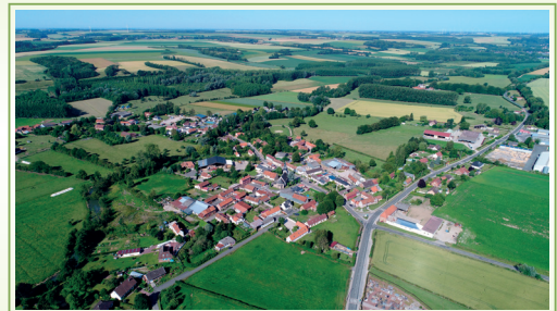
Paysage de polyculture-polyélevage en Ternois, Villers-l'Hôpital (Pas-de-Calais) 3

Les Hauts-de-France sont la quatrième économie agricole et agroalimentaire française. La diversification de ses productions végétales et agricoles a modelé le territoire. Les cultures céréalières et industrielles occupent les deux tiers de la surface agricole utile.