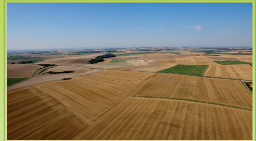
Paysage d'openfield en Vermandois (Aisne) 1