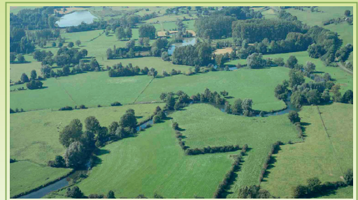
Paysage de bocage en Thiérache (Aisne) 2