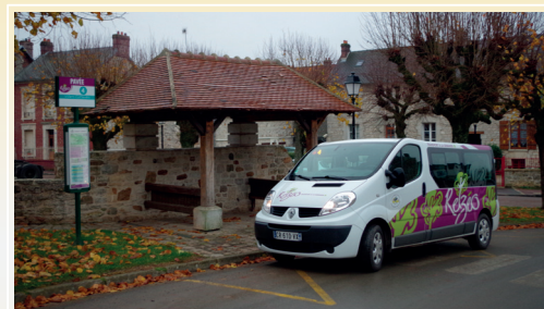
Transport à la demande (TAD), Faverolles (Aisne) 3