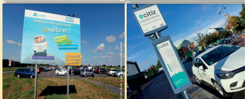
Aire de covoiturage, Lillers (Pas-de-Calais) 4