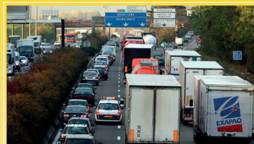
Congestion de l'autoroute A1 près de Lille (Nord) 1

Transport à la demande (TAD) : système de transport fonctionnant sur appel préalable d'un ou plusieurs clients et dont les jours de fonctionnement, les horaires de desserte et/ou les lieux de destination sont fixés à l'avance.