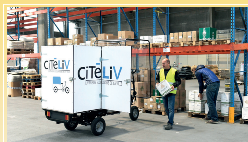
Logistique urbaine à Lille (Nord) 2