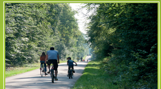
Forêt de Senlis (Oise) 3

Tous les parcs naturels régionaux (PNR) de la région présentent des milieux humides et des milieux forestiers d'une grande biodiversité qui valent à de nombreux sites d'être inscrits dans le réseau Natura 2000.