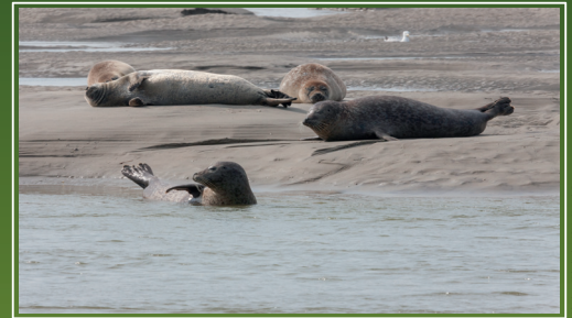
Baie d'Authie (Pas-de-Calais) 1