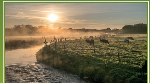
Vallée de l'Helpe Majeure, Saint-Hilaire-sur-Helpe (Nord) 2