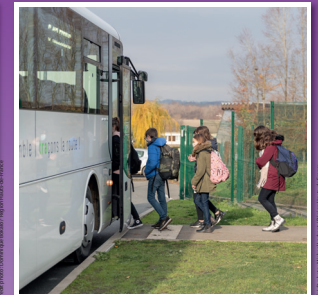
Autocar scolaire, Gauchy (Aisne) 2