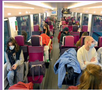
TER Lille - Arras 1

Polarisation : La polarisation est le résultat de l'interaction entre un centre, dénommé pôle (là où se concentrent les activités humaines), et son aire d'influence. On parle parfois aussi d'attractivité ou encore de territorialisation.