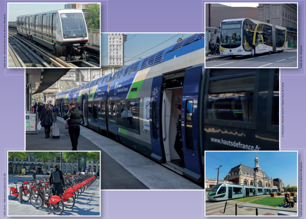
TER Hauts-de-France (gare d'Amiens) - Métro de Lille - Bus à haut niveau de service d'Amiens - Tramway de Valenciennes - V' Lille